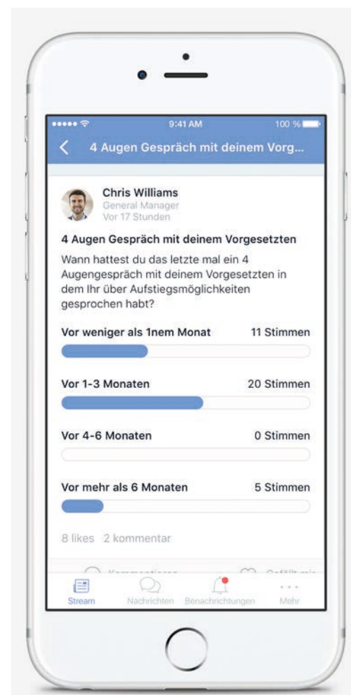
Mit mobilen Intranetlösungen werden auch Mitarbeiter ohne PC-Arbeitsplatz erreicht.

Das Telekommunikationsunternehmen launcht fast im Zweijahresrhythmus ein komplett überarbeitetes Intranet, das auch den Anforderungen der modernen (mobi-