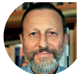
Daniel Vasella ehem. CEO & Chairman, Novartis