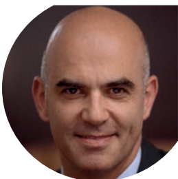
Alain Berset Bundesrat, Vorsteher EDI